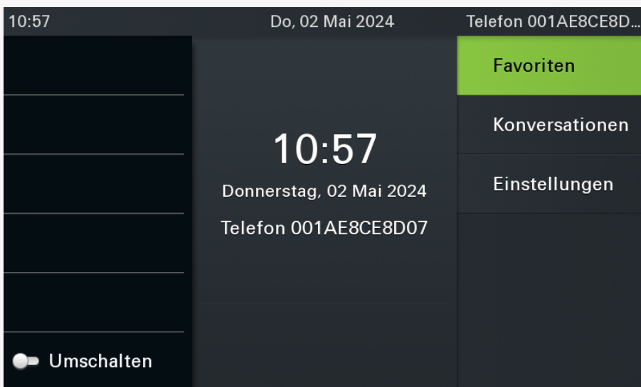
Bildschirm des OpenScape CP700 SIP nach der Inbetriebnahme. Die Anzeige auf anderen Modellen weicht ab.

Dabei gehen bereits vorhandene Benutzerdaten verloren. Versuchen Sie daher im Zweifelsfall zunächst, sich als Benutzer anzumelden . Wenn dies wiederholt fehlschlägt, führen Sie die folgenden Schritte aus.