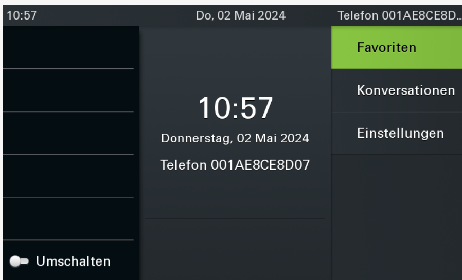
Bildschirm des OpenScape CP700 SIP nach der Inbetriebnahme. Die Anzeige auf anderen Modellen weicht ab.

Dabei gehen bereits vorhandene Benutzerdaten verloren. Versuchen Sie daher im Zweifelsfall zunächst, sich als Benutzer anzumelden . Wenn dies wiederholt fehlschlägt, führen Sie die folgenden Schritte aus.