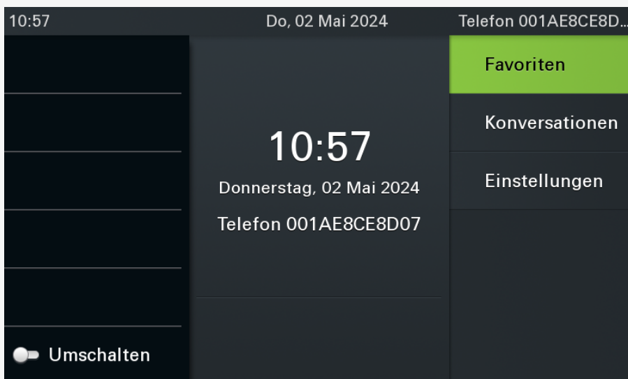
Bildschirm des OpenScape CP700 SIP nach der Inbetriebnahme. Die Anzeige auf anderen Modellen weicht ab.

Dabei gehen bereits vorhandene Benutzerdaten verloren. Versuchen Sie daher im Zweifelsfall zunächst, sich als Benutzer anzumelden . Wenn dies wiederholt fehlschlägt, führen Sie die folgenden Schritte aus.